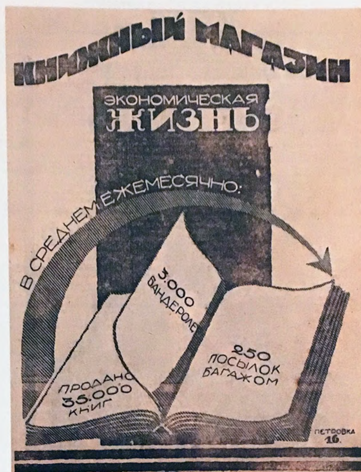
«ЭЖ». 1925 г.