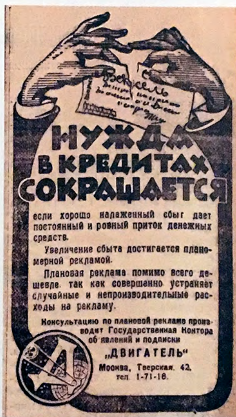
«ЭЖ». 1925 г.